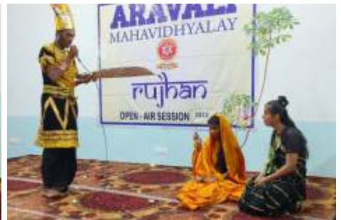
अरण्य काण्ड व किष्किन्धा काण्ड