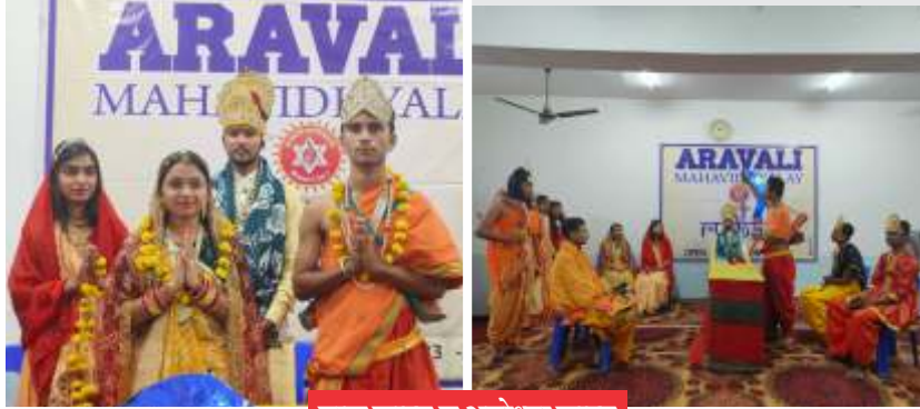
बाल काण्ड व अयोध्या काण्ड