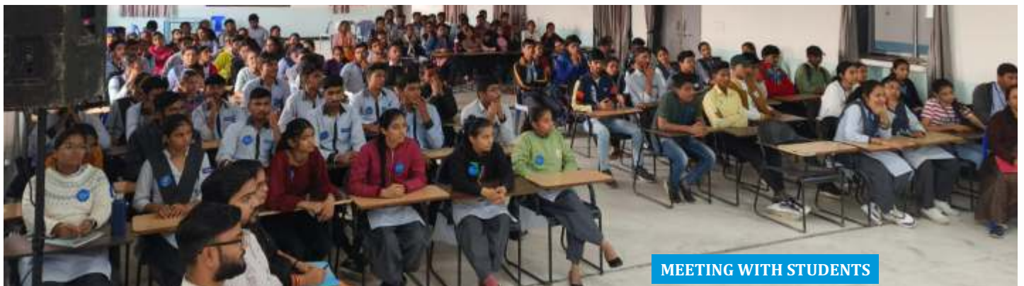
MEETING WITH STUDENTS